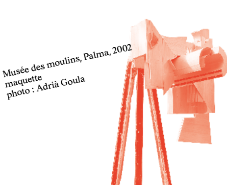
Musée des moulins, Palma, 2002 maquette

Architects Eva Prats and Ricardo Flores founded the Flores & Prats studio in Barcelona in 1998. In 2002, they completed the transformation of a former flour mill into a museum, the Mills Museum, in Palma de Mallorca. This project established the foundations of their practice: rehabilitating existing buildings by first cataloguing, through hand drawing, all the layers composing them. By situating their intervention in the wake of these "memorial" traces, Eva Prats and Ricardo Flores thus extend the history of the buildings entrusted to them. The exhibition Emotional Heritage , is structured around four themes. Drawing with Time, The Right to Inherit, The Value of Use, and The Open Condition of Ruins are embodied through five buildings emblematic of the studio's approach. An abundant selection of documents, photographs, models, drawings, and films punctuates the six bays of the large gallery of the Bordeaux architecture center, offering visitors multiple invitations to step behind the scenes of Flores & Prats' architectural process.