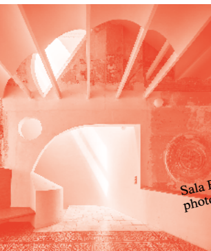
Sala Beckett, Barcelone, 2017