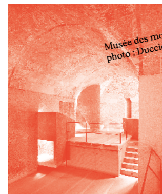
Musée des moulins, Palma, 2002