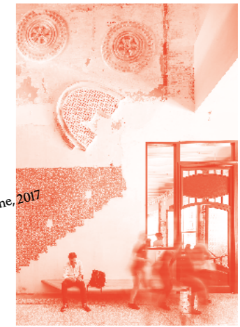
Sala Beckett, Barcelone, 2017

arc en rêve centre d'architecture, fondé à Bordeaux en 1981, propose des expositions, des ateliers de sensibilisation, des conférences et des publications autour de l'architecture, de la ville et plus largement de l'environnement bâti et naturel. Depuis sa création, le centre œuvre à élargir la perception de l'architecture dans la société, au-delà de la seule construction de bâtiments ou de l'aménagement urbain pour créer un espace de dialogue et de réflexion critique sur les manières d'habiter et de transformer le monde.