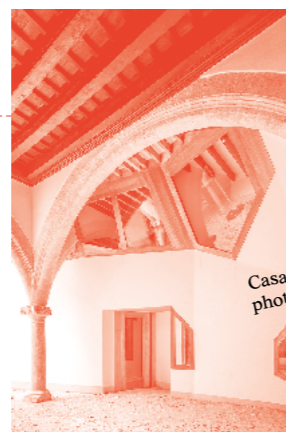
Casal Balaguer, Palma, 2016

«Chaque génération dispose du droit de transformer le bâti dont elle a hérité pour l'investir à son tour.» Faire place à des usages contemporains dans le périmètre ou le prolongement de vestiges n'est pas toujours chose aisée. Parfois, l'existant se montre récalcitrant à recevoir un nouveau programme. Eva Prats et Ricardo Flores élaborent alors des solutions qui complètent le palimpseste architectural plutôt que d'y entrer par effraction. La réhabilitation du Centre culturel Casal Balaguer, à Majorque, est à cet égard une formidable étude de cas. En collaboration avec Duch-Pizà Arquitectes, Flores & Prats procède à la transformation de cette ancienne maison familiale par étapes successives... depuis près de 18 ans. «Ce bâtiment est une véritable capsule temporelle : construit au XIV e siècle, il a été étendu au XVI e siècle, puis à nouveau au XVIII e siècle. Il nous fallait le réhabiliter sans perdre le fil de son histoire majorquine. Par exemple, nous avons conçu et réalisé un escalier qui s'arrime à la tour existante : l'un et l'autre bénéficient de leurs ouvertures respectives, à la manière de Roméo et Juliette.»