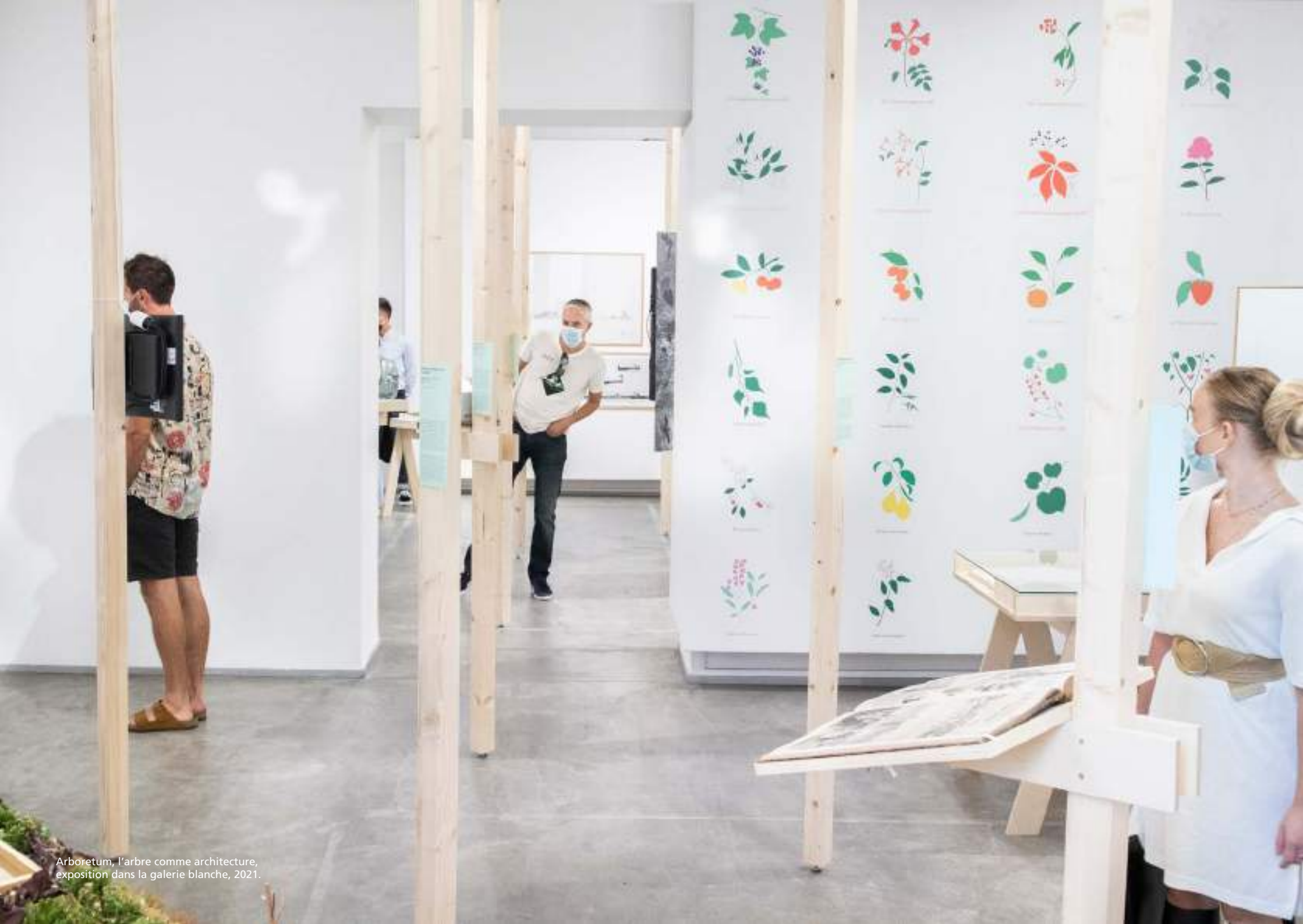
Arboretum, l'arbre comme architecture, exposition dans la galerie blanche, 2021.