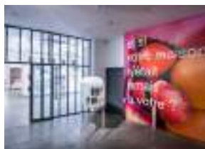
La galerie blanche 150 m 2