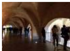
Les mezzanines 1 000 m 2