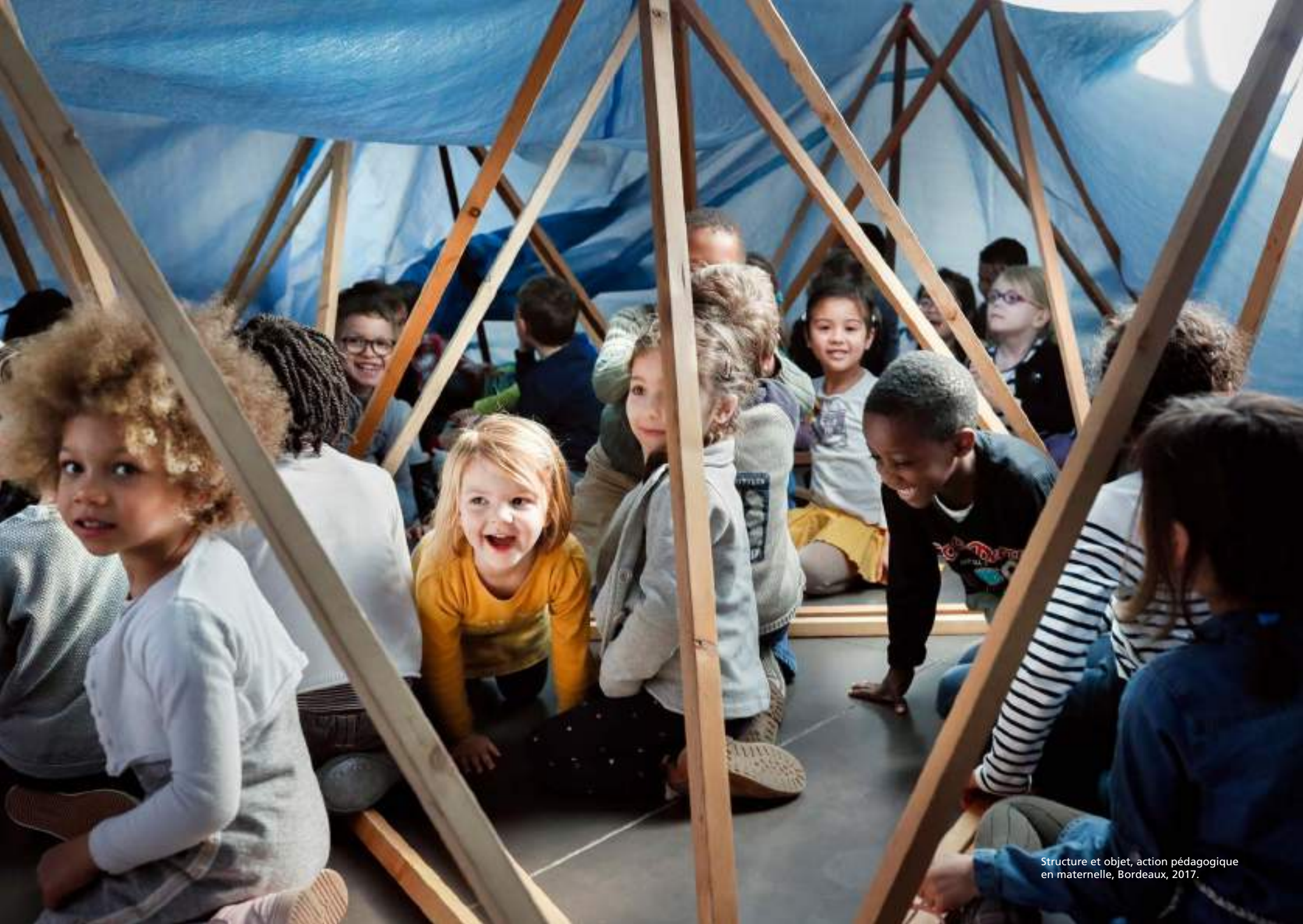
Structure et objet, action pédagogique en maternelle, Bordeaux, 2017.