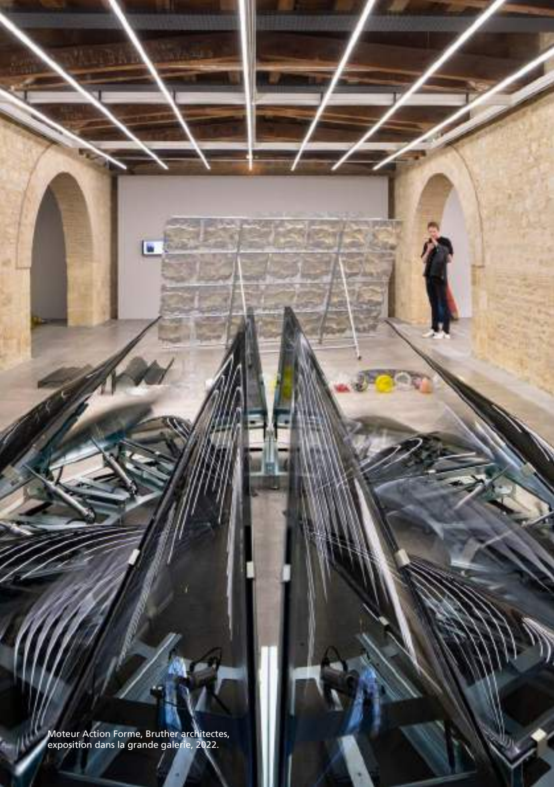
Moteur Action Forme, Bruther architectes, exposition dans la grande galerie, 2022.

Depuis sa création, arc en rêve fonctionne comme un laboratoire capable d'identifier et faire résonner les pratiques émergentes en architecture et en urbanisme.