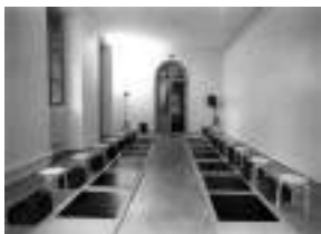
L'espace pédagogique 75 m 2