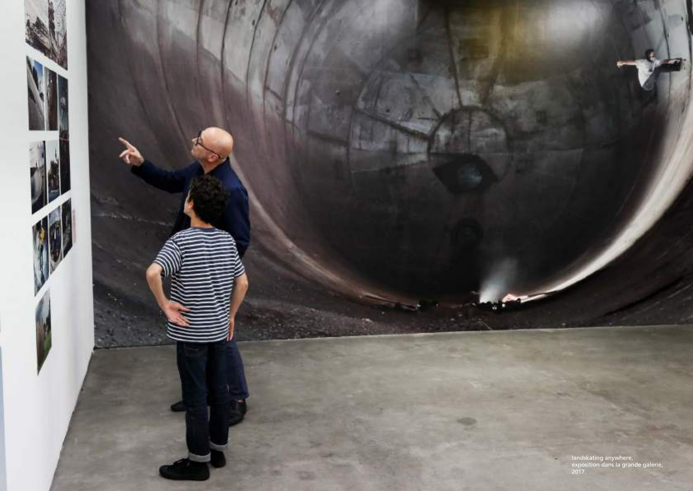
landskating anywhere, exposition dans la grande galerie, 2017.