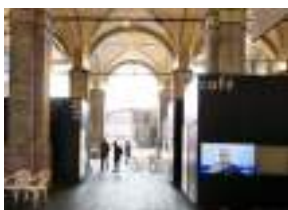
Le parvis 400 m 2