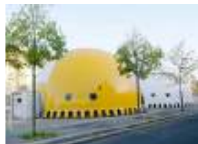
Le gonflable 200 m 2