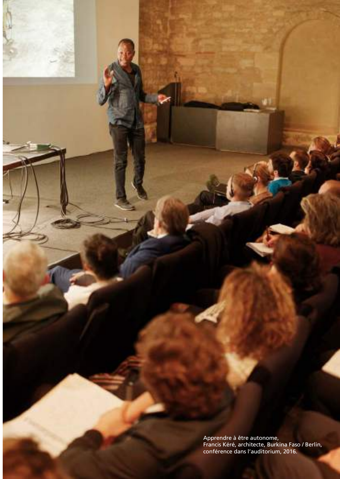
Apprendre à être autonome, Francis Kéré, architecte, Burkina Faso / Berlin, conférence dans l'auditorium, 2016.