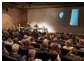
L'auditorium 220 m 2