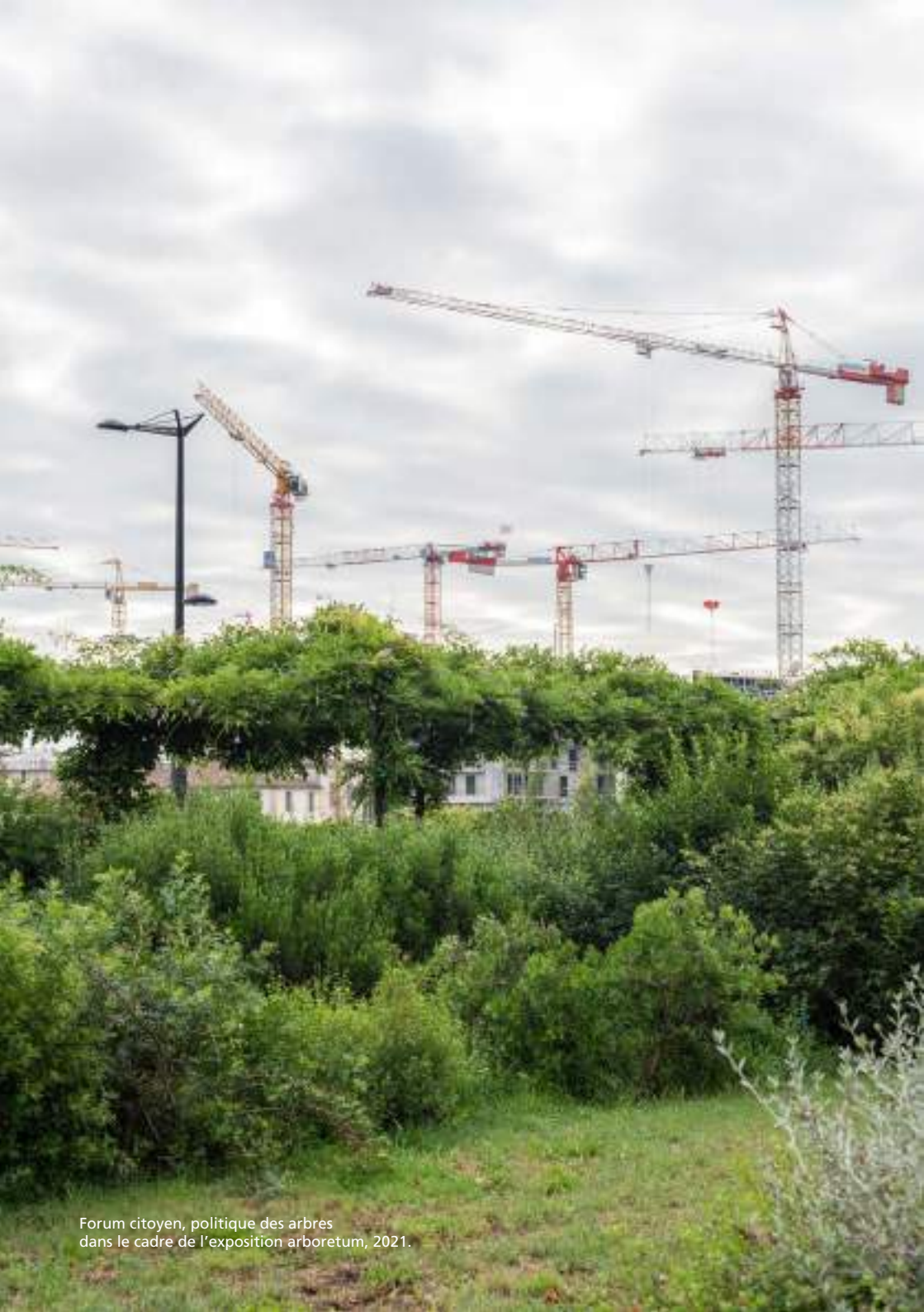
Forum citoyen, politique des arbres dans le cadre de l'exposition arboretum, 2021.