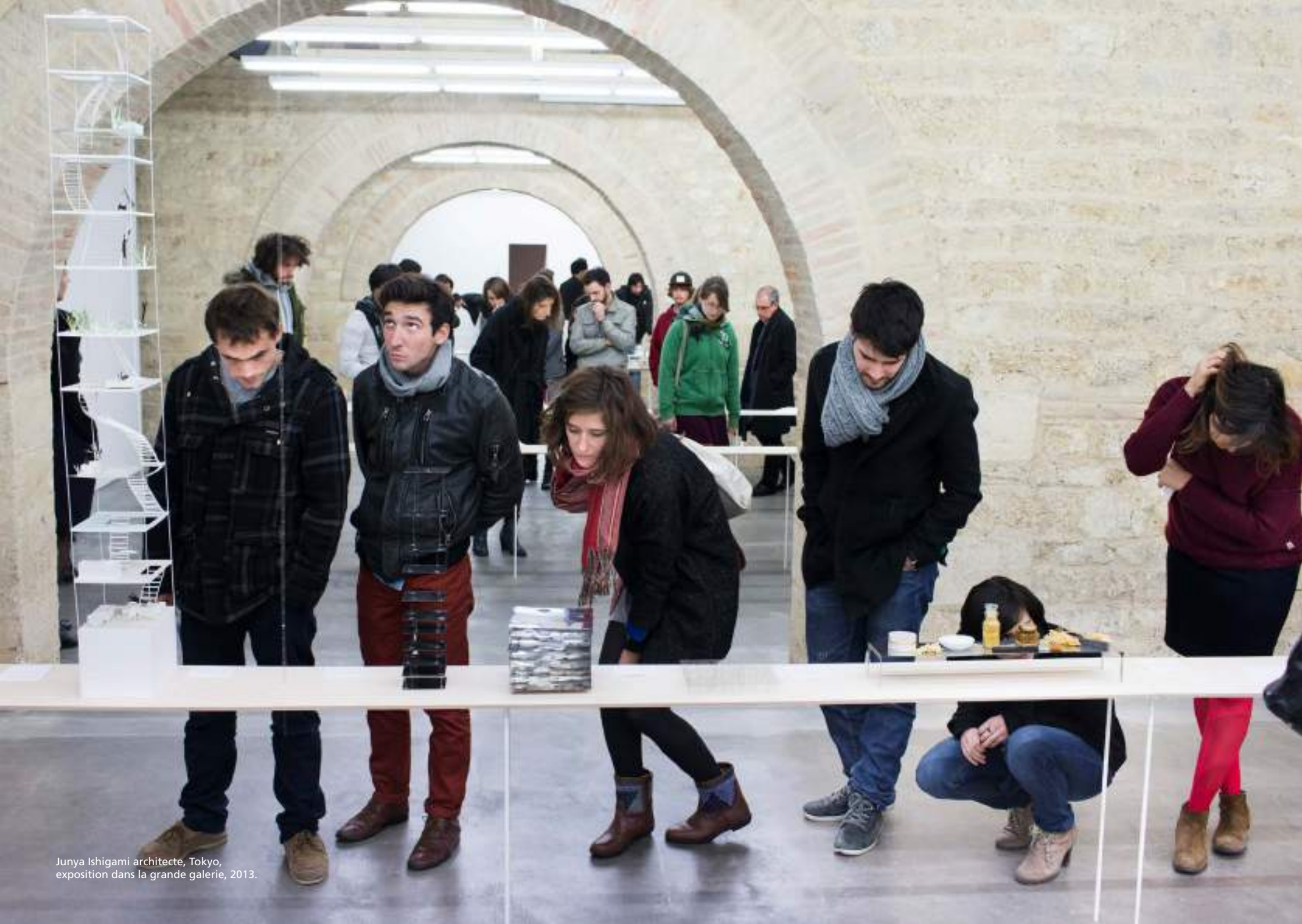
Junya Ishigami architecte, Tokyo, exposition dans la grande galerie, 2013.