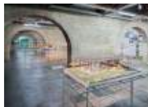
La grande galerie 450 m 2

arc en rêve centre d'architecture est installé à Bordeaux dans l'entrepôt Lainé aux côtés du CAPC, Musée d'art contemporain. Ces deux structures ont contribué à faire du site un espace culturel important de la ville. Certains espaces sont partagés avec le CAPC.