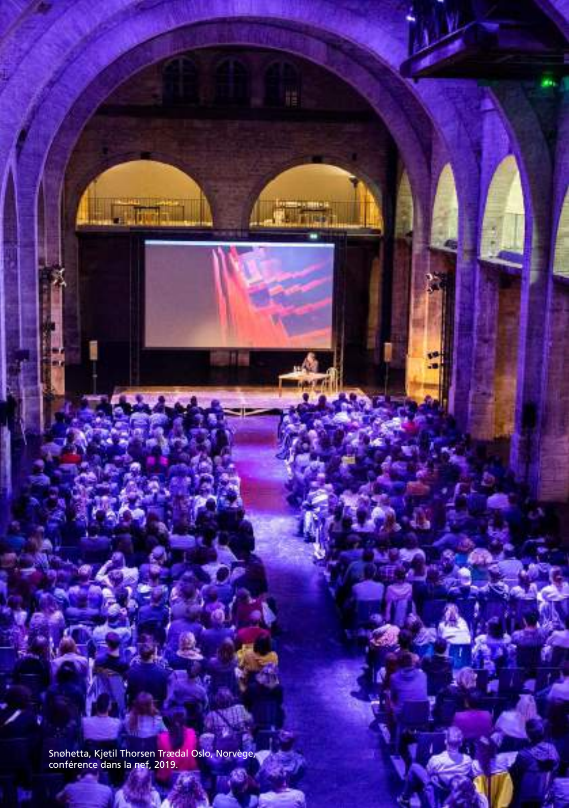
Snøhetta, Kjetil Thorsen Trædal Oslo, Norvège, conférence dans la nef, 2019.

Chaque formule proposée est unique et adaptée aux souhaits de chaque entreprise. Il est possible de choisir la forme de mécénat qui vous convient ainsi que les contreparties correspondantes.