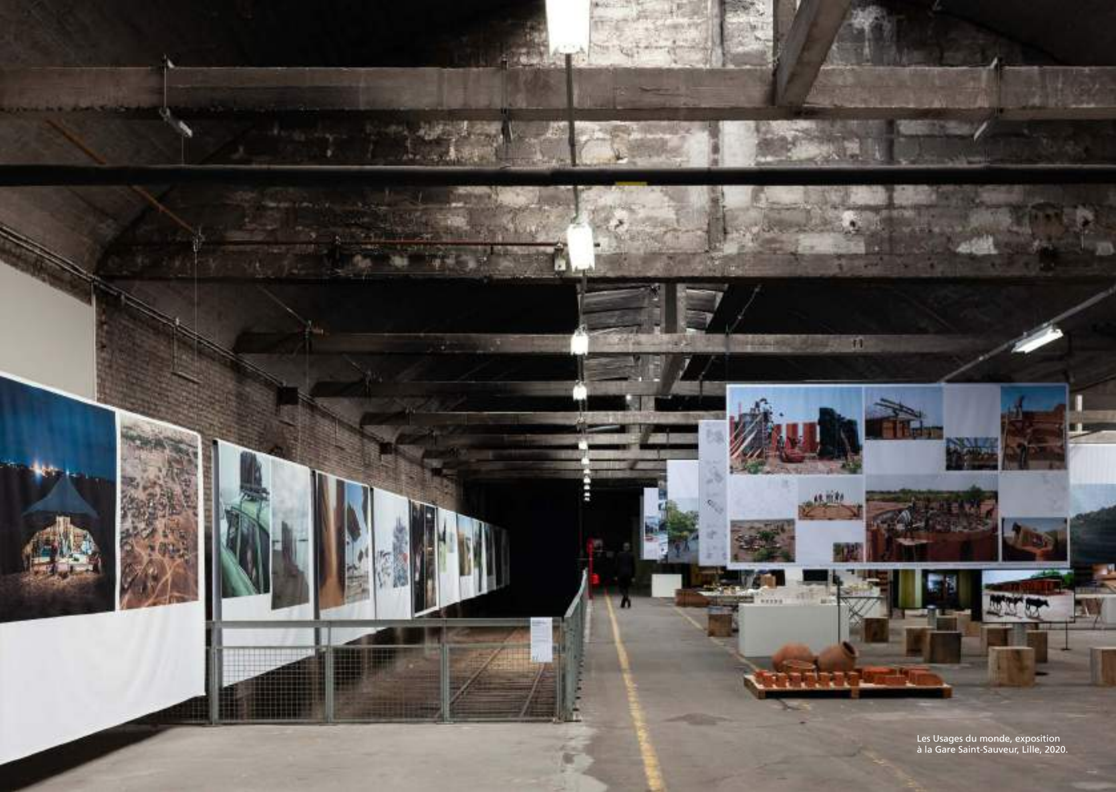
Les Usages du monde, exposition à la Gare Saint-Sauveur, Lille, 2020.