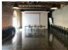
La salle de communication 70 m 2