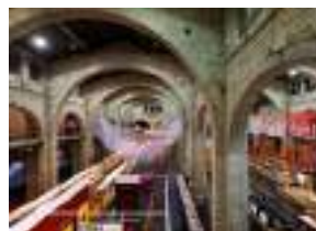
La nef de l'entrepôt 1 500 m 2