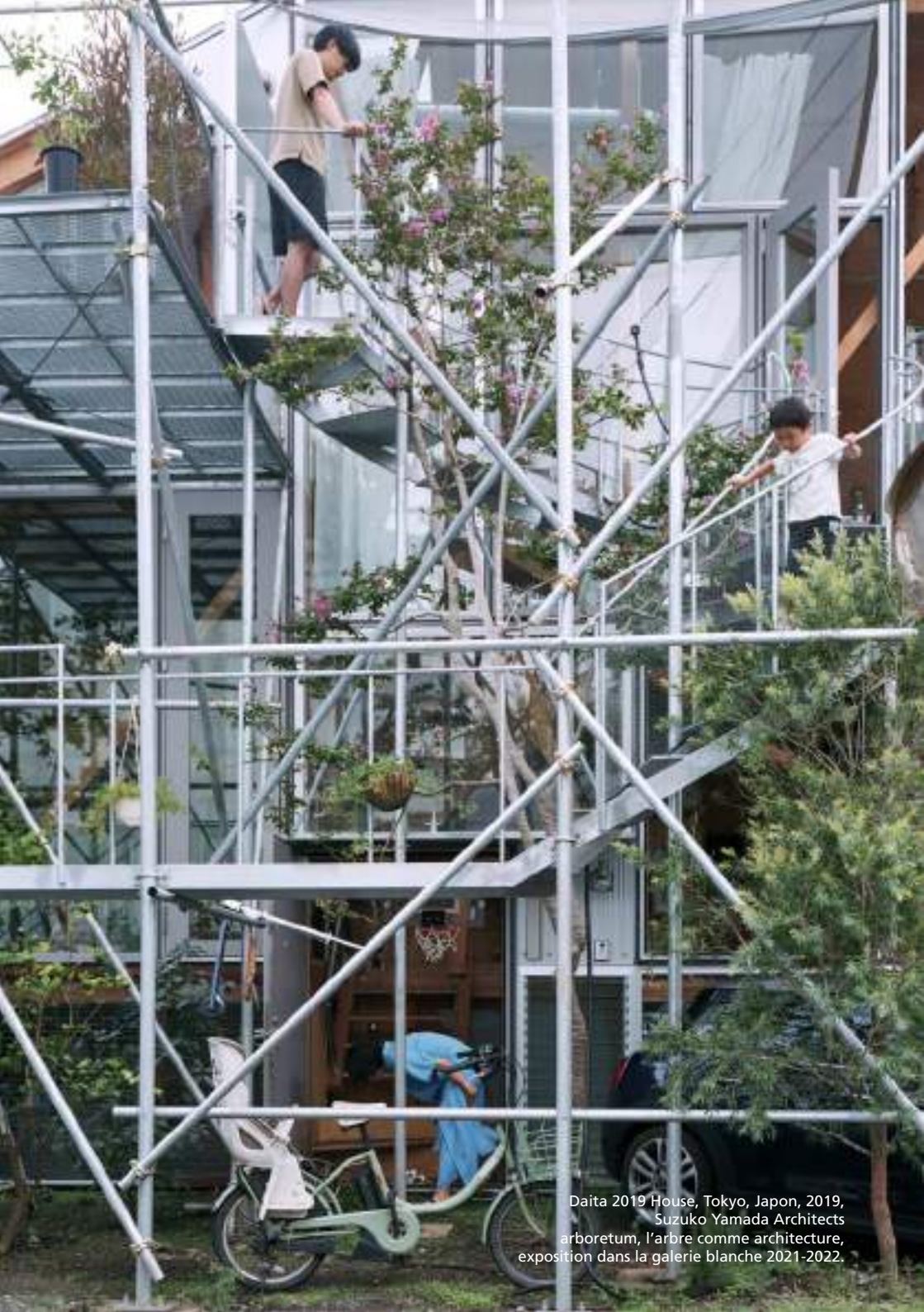
Daïta 2019 House, Tokyo, Japon, 2019, Suzuko Yamada Architects arboretum, l'arbre comme architecture, exposition dans la galerie blanche 2021-2022.

Dans un monde en plein bouleversement, traversant des crises de toute nature, l'art, la culture et l'architecture sont une expression de notre société. Elles incarnent sa vision du monde et la place que celle-ci accorde à ses habitants et aux différentes manières de vivre ensemble.