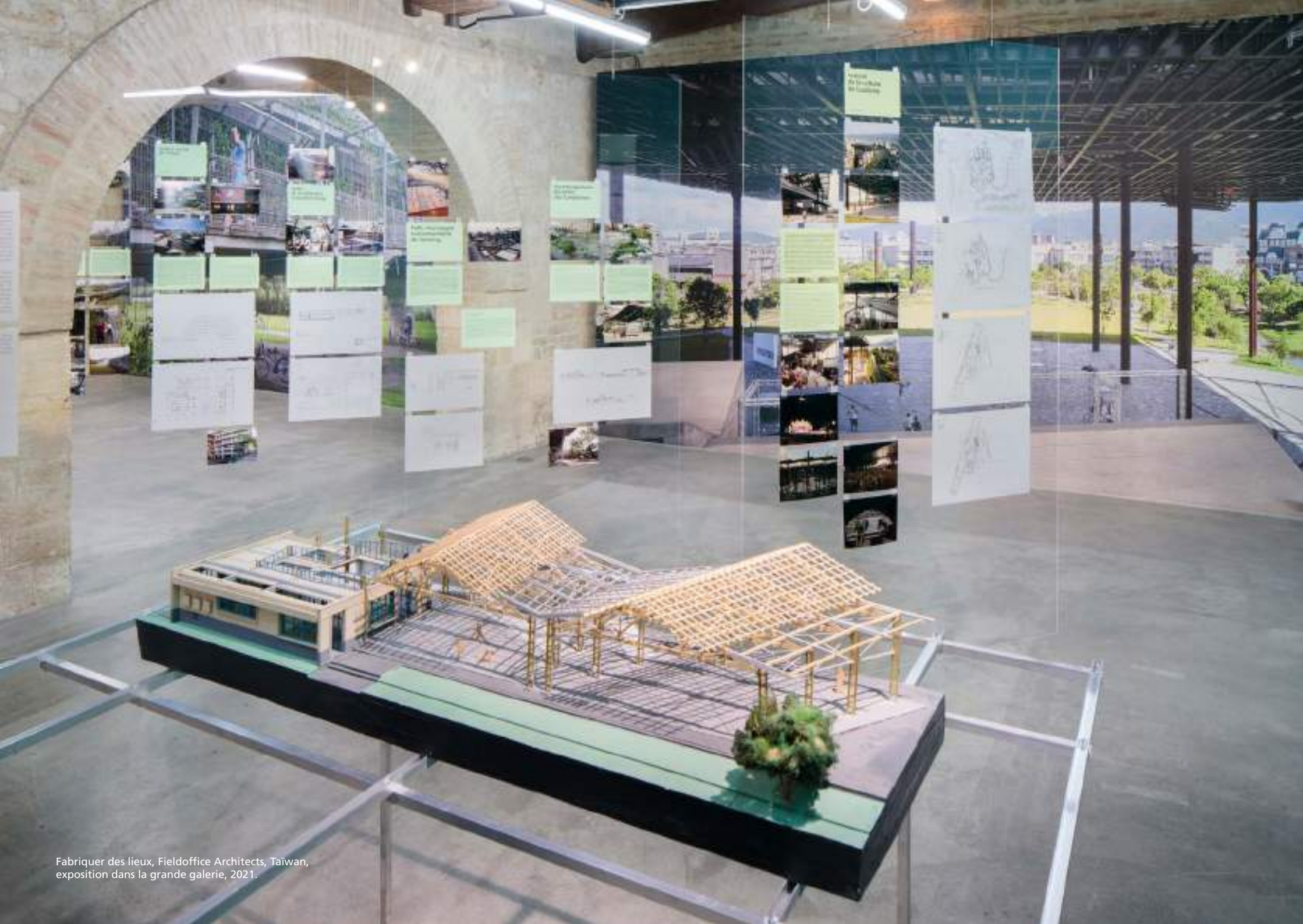
Fabriquer des lieux, Fieldoffice Architects, Taïwan, exposition dans la grande galerie, 2021.