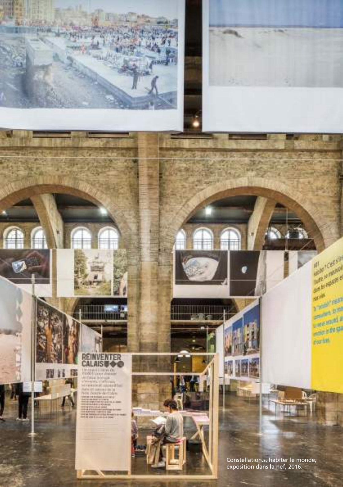
Constellation.s, habiter le monde, exposition dans la nef, 2016.

Dans ce cadre, arc en rêve conçoit et développe de nombreux événements et actions : expositions, expérimentations, conférences, tables-rondes, débats, éditions, ateliers avec les enfants, séminaires pour adultes, visites de bâtiments, parcours urbains et des expérimentations sur le terrain de l'aménagement.