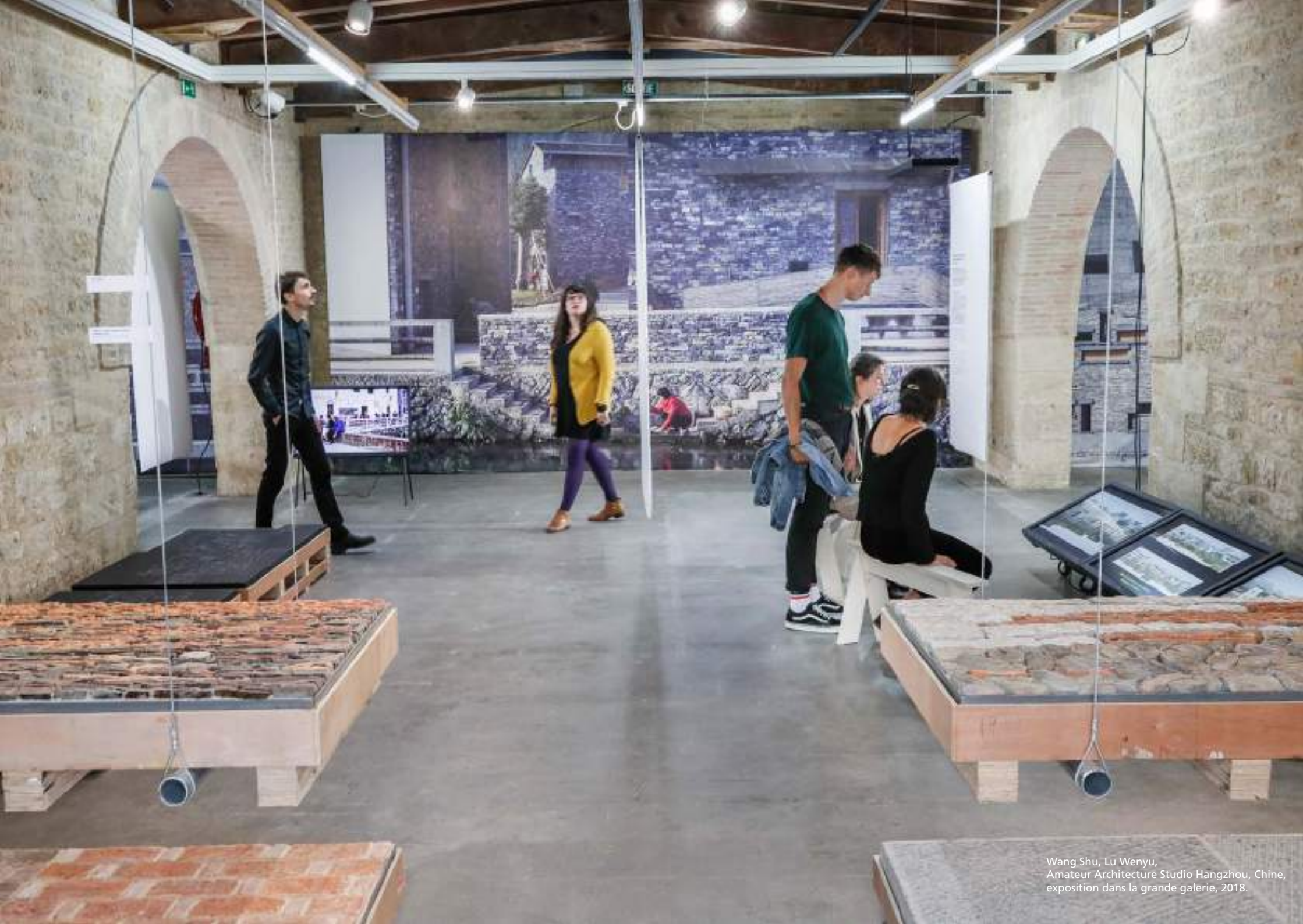
Wang Shu, Lu Wenyu, Amateur Architecture Studio Hangzhou, Chine, exposition dans la grande galerie, 2018.